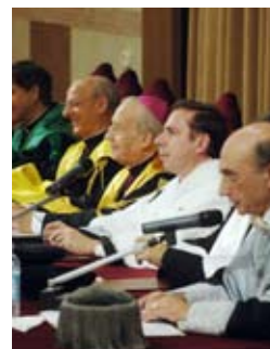
In copertina: Il tavolo della presidenza durante l'inaugurazione dell'a.a.

Finito di stampare nel mese di gennaio 2006