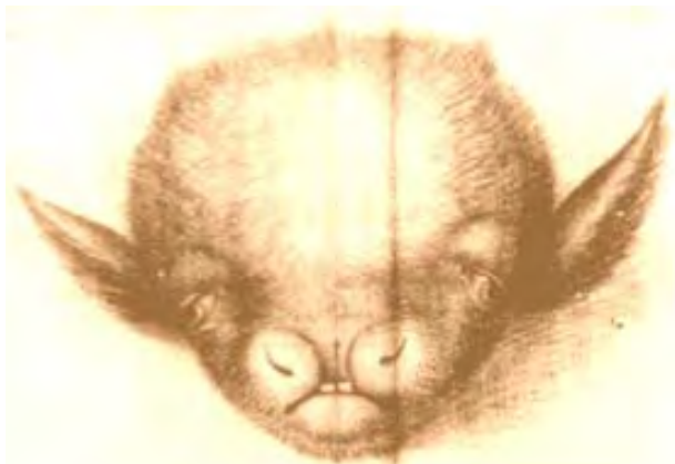
Fig. 6 Disegno dell'arciduchessa Anna d'Austria, sorella di Ferdinando II di Toscana, del vitello affetto da idrocefalo, inviato al fratello, Firenze, Archivio di Stato .

Nel XVII secolo gli studi scientifici di Marco Aurelio Severino (1580-1656), Thomas Bartholin e Paul Barbette (1620-1666) riaccessero l'interesse verso l'anatomia dei ventricoli e l'idrocefalo. La maggior parte di questi studi riguardava descrizioni cliniche di casi pediatrici di idrocefalo. Nel 1669, Stenone sezionò un vitello affetto da idrocefalo ostruttivo causato da un tumore cistico localizzato vicino al chiasma ottico. La lettera scientifica che descrive la dissezione, De vitulo hydrocephalo epistola , fu pubblicata da Thomas Bartolin su Acta Medica et Philosophica Hafniensia nel 1673 e rappresenta la prima vera spiegazione fisiopatologica sullo sviluppo dell'idrocefalo (fig. 6).