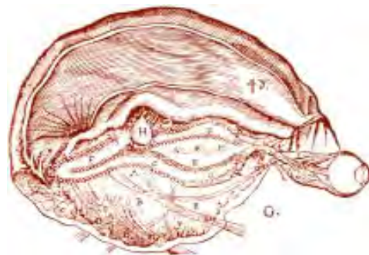
Fig. 3 Disegno originale da L'Homme (1647) di Cartesio che mostra la supposta localizzazione della ghiandola pineale (H) rispetto ai ventricoli (E) (2). Secondo la descrizione di Cartesio la ghiandola pineale era il luogo primario per l'interazione mente-corpo negli umani. Scriveva Cartesio: Così, quando la mente vuol ricordare qualcosa, questa volontà fa oscillare la ghiandola prima da un lato e poi dall'altro, guidando in questo modo gli spiriti verso zone diverse del cervello, sinché non incontrano quella che contiene le tracce, lasciate dall'oggetto che vogliamo ricordare (2).

La ricerca anatomica di Stenone metteva in luce l'importanza della dissezione congiunta a un'osservazione accurata e respingeva i modelli anatomici del suo tempo, influenzati pesantemente dalle concezioni galeniche (1). E' interessante notare come abbia anticipato concettualmente la tecnica di dissezione delle fibre per studiare la struttura interna del cervello (14). La sua fedeltà ai risultati sperimentali - e l'onesta interpretazione degli stessi - lo portarono al rifiuto nei confronti di qualunque cieca dipendenza rispetto all'Autorità scientifica e filosofica del tempo. Proprio per questi motivi, rifiutò la teoria della sede dell'anima nel sistema ventricolare e le fantasiose speculazioni di Willis sulle funzioni dei nuclei della base e del corpo calloso (3). Nello stesso modo Stenone contestò le ipotesi anatomiche di Cartesio riguardo alla ghiandola pineale. In L'Homme , Cartesio aveva descritto il corpo umano come una macchina controllata dall'anima, la cui sede era la ghiandola pineale (2) (Fig. 3).