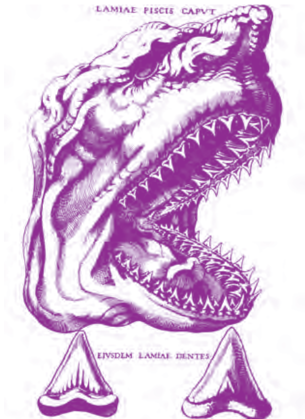
Fig. 2 Litografia Da Canis carchariae dissectum caput (1667), in cui Steno spiegava l'origine fossile delle glossopetrae e poneva le basi della paleontologia.

Dal 1666 Stenone lavorò come scienziato alla corte del Gran Duca di Firenze Ferdinando II (1610-1670), dove collaborò con gli scienziati della Accademia del Cimento . Nello stesso anno sezionò la testa di un enorme squalo, catturato vicino a Livorno e notò la somiglianza fra i denti di questo esemplare e le glossopetrae melitenses (le lingue di pietra di Malta) che erano ritenute lingue di serpente pietrificate da San Paolo in visita a Malta. In Canis carchariae dissectum caput (la testa dello squalo sezionata), Stenone suggerì che le glossopetrae fossero fossili di denti di squalo, fondando la paleontologia moderna (fig. 2) (13).