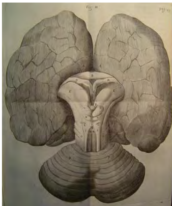
Fig. 4 Illustrazioni da Cerebri Anatome da Willis di un cervello normale.

Stenone progettò alcuni studi per estendere la conoscenza del sistema nervoso. Suggerì di studiare l'anatomia comparata e l'embriologia negli animali per acquisire informazioni più comprensibili di quelle possibili studiando l'uomo adulto. Propose anche di studiare gli